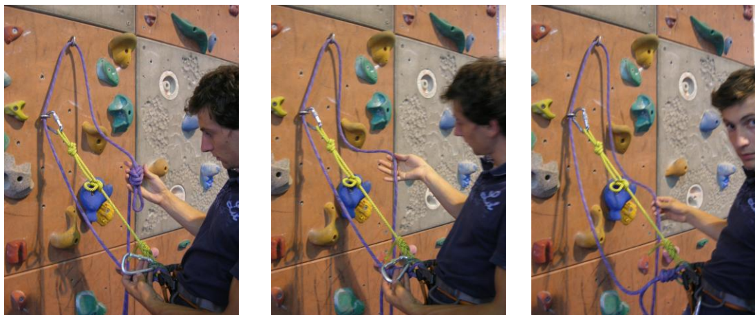
démousquetonner le double huit du pontet et le défaire