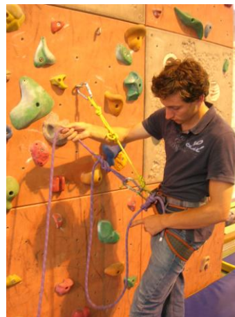
relier le double huit au pontet par le mousqueton à vis