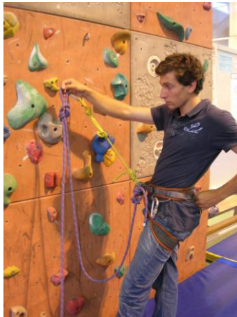
faire un double huit