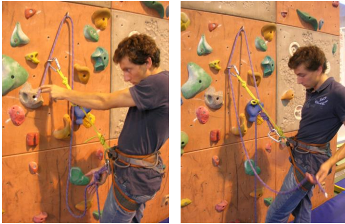
passer le brin de corde dans les anneaux de descente