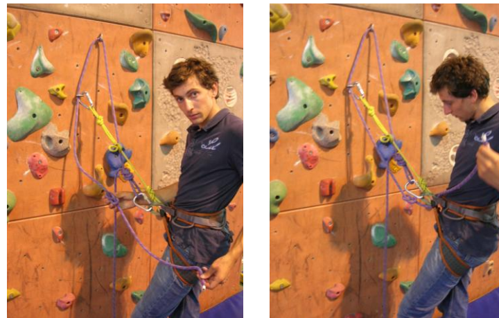
se réencorder et faire en sorte que tout soit clair sur le baudrier