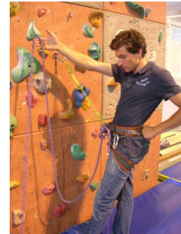
prendre une boucle de mou