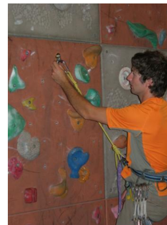
mettre le maillon dans la plaquette