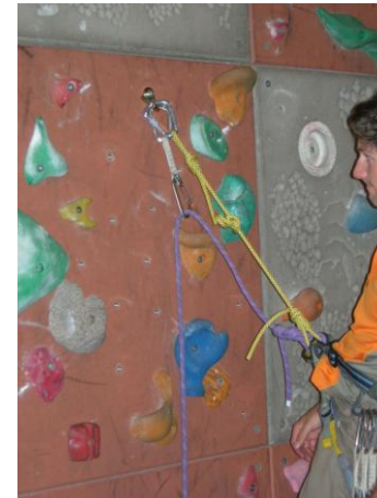
se vacher dans la plaquette