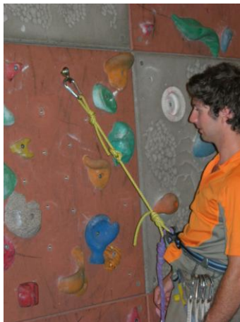
enlever la dégaine