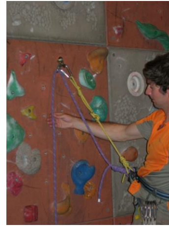
passer la corde dans le maillon et bien le visser