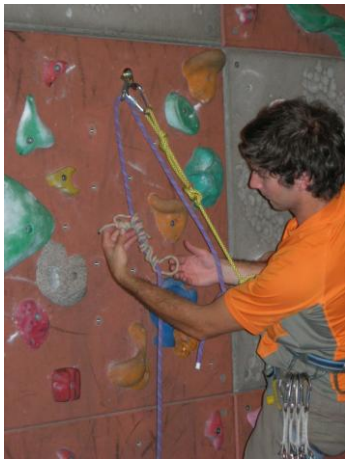
tresser son marchard