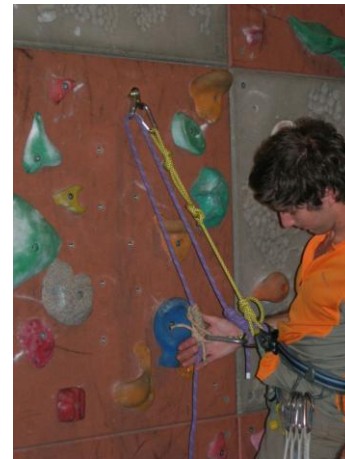
relier le marchard au pontet par un mousqueton à vis