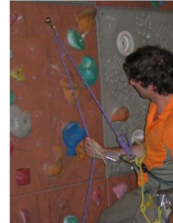
descendre en faisant coulisser le machard enlever toutes les dégaines au fur et à mesure