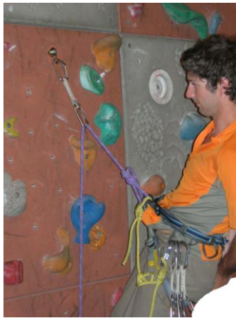
se faire prendre sec

descendre pour prendre un machard et remonter. Normalement vous avez déjà un mousqueton à vis.